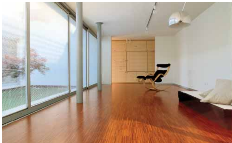
Residenza privata / Private house Tende ScreenLine su grandi serramenti scorrevoli ScreenLine blind systems on large sliding windows