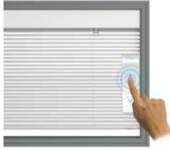
Salita / Raising