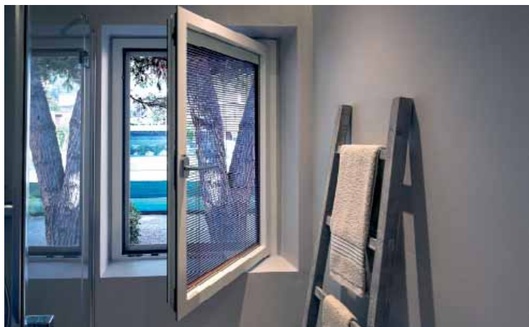
Residenza privata / Private house Tenda motorizzata ScreenLine su finestra ad un'anta ScreenLine motorised blind on casement window