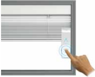
Discesa / Lowering