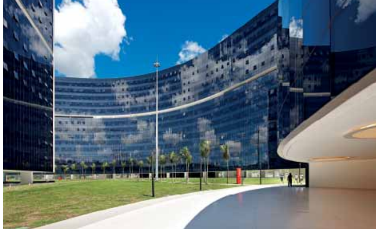
Cidade Administrativa Minas Gerais - Brazil 22,000 tende in vetrocamera ScreenLine 22,000 ScreenLine integrated blind systems